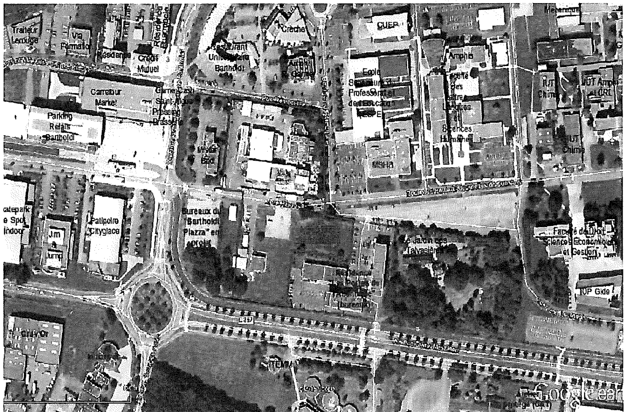
Environnement du site